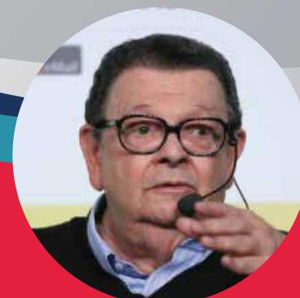
Antônio Delfim Netto